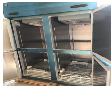
節能冷凍設備 (節能率 24%)

◀ 將原本較耗電的舊型號四門冰箱換成管冷式節能新產品，每年可節省電費約 1 萬元。