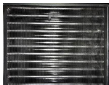
清洗後雙門玻璃冰箱壓縮機 (節能率 9%)

◀ 清洗冷凍冷藏系統可回復其空氣流通量，提高其運轉效率，達到降低能耗、除臭等效益。