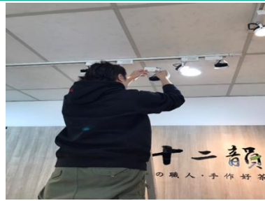
LED 燈具軌道燈 (節能率 56%)

◀ 將原有的舊式燈泡、日光燈全數改成較省電且壽命較長的 LED 燈，每年可節省電費約 1.6 萬元。