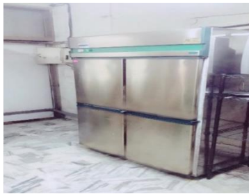
舊型不銹鋼冷藏冷凍冰箱